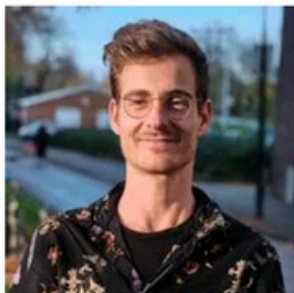
Hessel Hij/hem Projectmedewerker